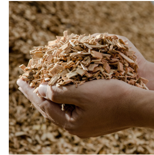
Energie aus Biomasse